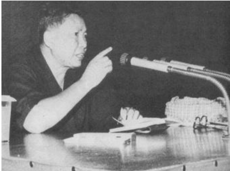
សាឡុត ស ហៅ លេខាបក្សកុម្មុយនិស្ត និងជានាយករដ្ឋមន្ត្រីនៃកម្ពុជាប្រជាធិបតេយ្យ

ពាក្យថា “ខ្មែរក្រហម” ត្រូវបានប្រើជាដំបូងដោយសម្តេច នរោត្តម សីហនុ ។ នៅក្នុងអំឡុងទសវត្សរ៍ឆ្នាំ៥០ សម្តេច នរោត្តម សីហនុ ដែលជា ប្រមុខដឹកនាំចលនាសង្គមរាស្ត្រនិយម បានធ្វើការបែងចែកខ្មែរជាបី ពណ៌ ដោយយោងទៅតាមនិន្នាការនយោបាយរបស់ពួកគេ គឺ “ខ្មែរ ស” សំដៅលើខ្មែរអ្នករាជានិយម “ខ្មែរខៀវ” ជាខ្មែរអ្នកសាធារណរដ្ឋនិយម និង “ខ្មែរក្រហម” គឺក្រុមខ្មែរកុម្មុយនិស្តនិយម ។ ក៏ប៉ុន្តែ ពីដំបូង ពាក្យថា “ខ្មែរ ក្រហម” នេះ ត្រូវបានប្រើដោយសំដៅលើក្រុមឆ្វេងនិយម នៅក្នុងចលនា សង្គមរាស្ត្រនិយមរបស់ព្រះអង្គផ្ទាល់ ។