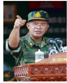
គណបក្ស ប្រជាជនកម្ពុជា