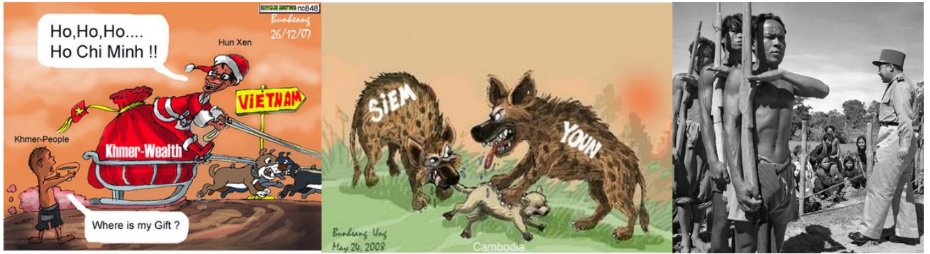
គោលដៅវង្សាសាសន៍យួន