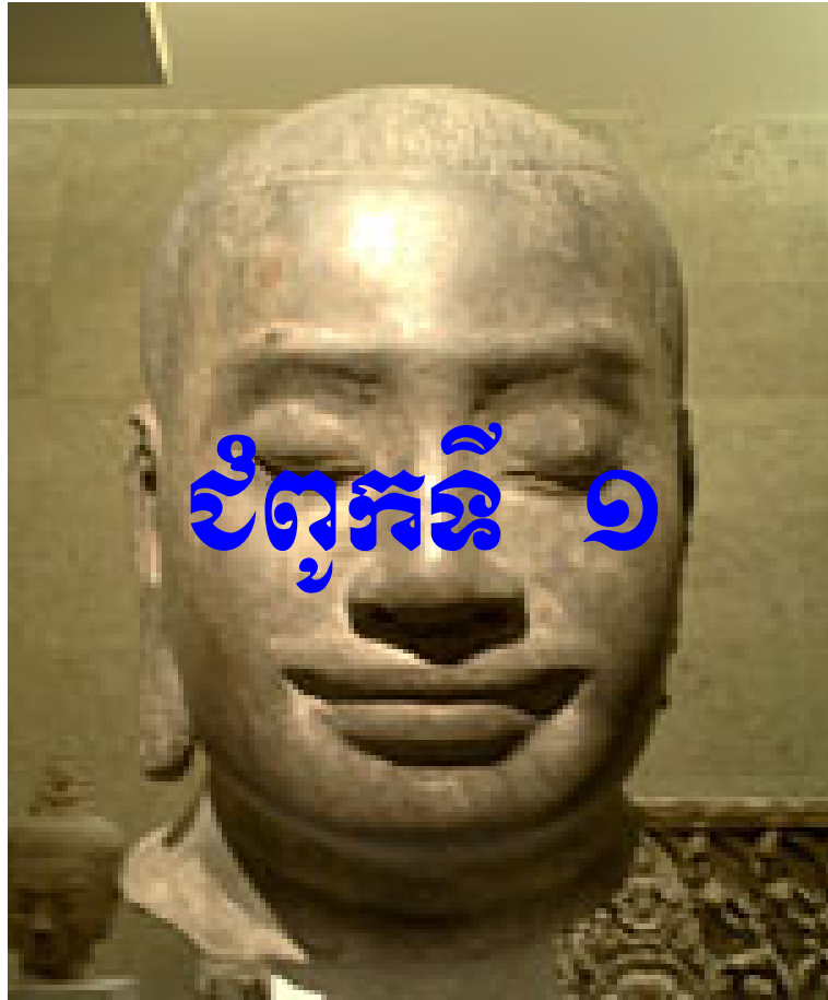
ព្រះបាទជ័យវរ្ម័នទី ៧ តំណាងមហាវិរក្សតស្តេចស្នេហាជាតិខ្មែរ