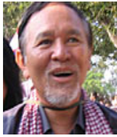
ប្រធានបក្ស សិទ្ធិចុស្ស