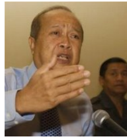
ប្រធានបក្ស គរោត្តមរណវិទ្ធិ