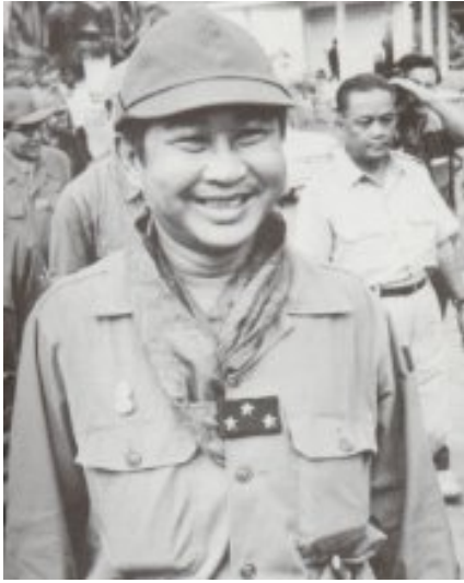
ឧត្តមសេនីយ៍ លន់ ឆល់ (សម័យសាធារណរដ្ឋខ្មែរ)