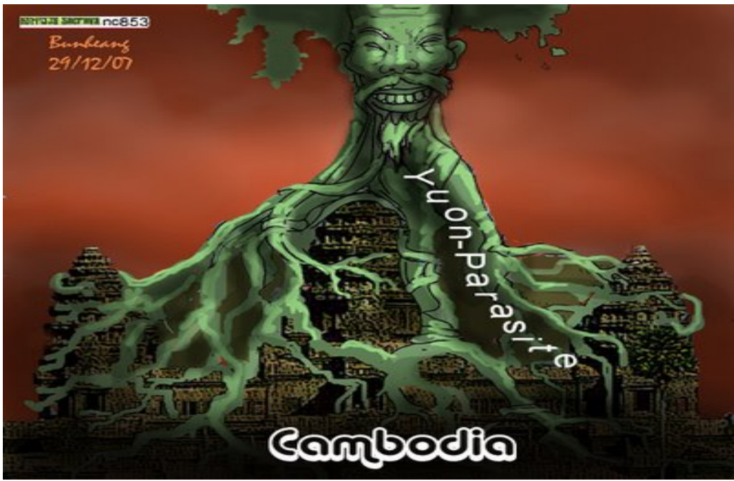
ប្រទេសខ្មែរស្ថិតក្រោមអាណានិគមន៍កុម្មុយនិស្តយួន ដែលមាន គណបក្សប្រជាជន ហ៊ុន សែន និង ស្តេច ជាទាំងបិទបាំង

យើងជាយោសនិកត្រូវតែគ្រប់គ្រងស្ថានភាពណ៍អោយបាន យល់ដឹងទាំងអស់អំពីព្រឹត្តិការណ៍នយោបាយ ដែលកំពុងកើតឡើងនៅក្នុងប្រទេសខ្មែរ ឬក្រៅប្រទេស ជាពិសេស ដំណើរវិវឌ្ឍន៍នយោបាយនៅក្នុងប្រទេសខ្មែរ ។ បច្ចុប្បន្ននេះ បើយើងមើលប្រទេសខ្មែរពីសំបកក្រៅ យើងឃើញគណបក្សប្រជាជន ដែលមានយួន នៅពីក្រោយ ខ្នង ពួកវាកាន់អំណាចកុម្មុយនិស្តផ្តាច់ការ តែវាយកសំបកប្រជាធិបតេយ្យមកពាក់ផ្នាក បន្តិប្រជាពលរដ្ឋខ្មែរ ។ តាមការពិតដំណើរការនយោបាយ និងប្រព័ន្ធគ្រប់គ្រងទាំងអស់បែបជាកុម្មុយនិស្ត ដែលស្ថិតក្រោមការត្រួតត្រា របស់យួន ។ តាមការដកស្រង់ចេញពីវិបសាយ យូធូប (Youtube) ហ៊ុន សែន និយាយសារភាពផ្ទាល់ថា ខ្ញុំនិយាយត្រង់តែម្តង គឺថាខ្ញុំអាយ៉ងយួន ឥឡូវមានទាហានយួន ជាស៊ុយវិល ១០០ ០០០ នាក់ នៅក្នុងប្រទេសខ្មែរ ។ ការដែលយួនរៀបយុទ្ធសាស្ត្រអោយមានព្រះមហាក្សត្រ គណបក្សប្រជាជន ហ៊ុន សែន និង សាសនាព្រះពុទ្ធ នេះគ្រាន់តែកត្តាចិត្តសាស្ត្រនយោបាយមួយ សំរាប់ធ្វើជាតំរូវបិទបាំងខ្មែរ ដើម្បីអោយខ្មែរអស់ចិត្តថា អ្វីៗទាំងអស់ ជារបស់ខ្មែរ ខ្មែរឯករាជ្យ ខ្មែរមានសន្តិភាព ក៏ប៉ុន្តែ ផលប្រយោជន៍ជាតិខ្មែរ ទឹកដីខ្មែរទាំងមូលនឹងត្រូវធ្លាក់លើ កណ្តាប់យួន ជាតិខ្មែរនឹងស្លាប់ ប្រៀបដូចជាដង្កូវដូងវាចូលស៊ីរូង ដល់បណ្តូលឈើ ហើយទីបំផុតឈើនោះ ត្រូវស្លាប់ឯងតែម្តង ។ យួនចូលមកប្រទេសខ្មែរ រស់នៅស្រេចតែចិត្ត ដំណើមផលប្រយោជន៍ខ្មែរ ត្រួតត្រាខ្មែរ ធ្វើវេច្ឆេទកម្មផ្សេងៗ កាប់សម្លាប់ខ្មែរ ដោយបន្តិធ្វើជាខ្មែរ មានអត្ត សញ្ញាណប័ណ្ណជាខ្មែរ និងមានសិទ្ធិបោះឆ្នោត ។ ប្រជាពលរដ្ឋខ្មែរពិតប្រាកដ ក្រីក្រ រហេមរហាម សុំទានគេ ហើយខិតខំធ្វើការជាខ្ញុំបំរើគេ ជាកម្មករសំណង់ផ្សេងៗ ទទួលប្រាក់ខែតិចតួចមិនបានគ្រប់គ្រាន់ខ្លះទៀតរត់មកសុំទានគេ ខ្លះធ្វើជាកម្មករនៅក្រៅប្រទេសទៀតផង ។