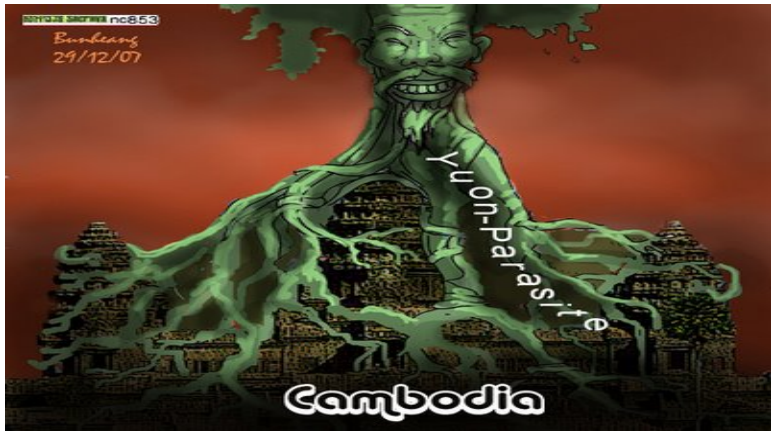
ប្រទេសខ្មែរស្ថិតក្រោមអាណានិគមន៍កុម្មុយនិស្តយួន ដែលមាន គណបក្សប្រជាជន ហ៊ុន សែន និង ស្តេច ជានាំបិទបាំង