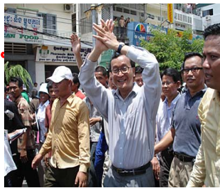
ប្រធានបក្ស សមរង្ស៊ី