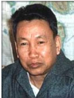
សា ហ៊ុន សែន ហៅប៉ុល ពត

ពេលដែលយួនចូលឈ្លានពាន នៅថ្ងៃទី ៧ មករា ១៩៧៩ គាត់បានគេចមកតាមជ្វាយដែន ហើយវាយតបត ជាមួយយួនឈ្លានពាន។ រហូតដល់កិច្ចព្រមព្រៀងទីក្រុងហ្សឺណែវ នៅថ្ងៃទី ២៣ តុលា ១៩៩១ តែមិនបានចូលមកបោះឆ្នោត ទេ ព្រោះគាត់មើលឃើញថា យួនបានបង្កប់នៅក្នុងគណបក្សប្រជាជន នៅក្នុងទឹកដីខ្មែរ។ ខ្មែរក្រហមបានធ្វើការតស៊ូជាមួយ គណបក្សប្រជាជនទៀតរហូត ដល់ឆ្នាំ ១៩៩៧ ទើបធ្វើសមរណកម្ម។ លោក ប៉ុល ពត បានចូលមរណៈភាព នៅថ្ងៃទី ១៧ មេសា ១៩៩៨ នៅក្នុងខ្ទមមួយ ដោយសាររោគព្យាបាលនៅតំបន់អន្លង់វែង។