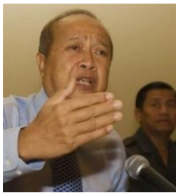
ប្រធានបក្ស សោត្តចរសេរិទ្ធិ