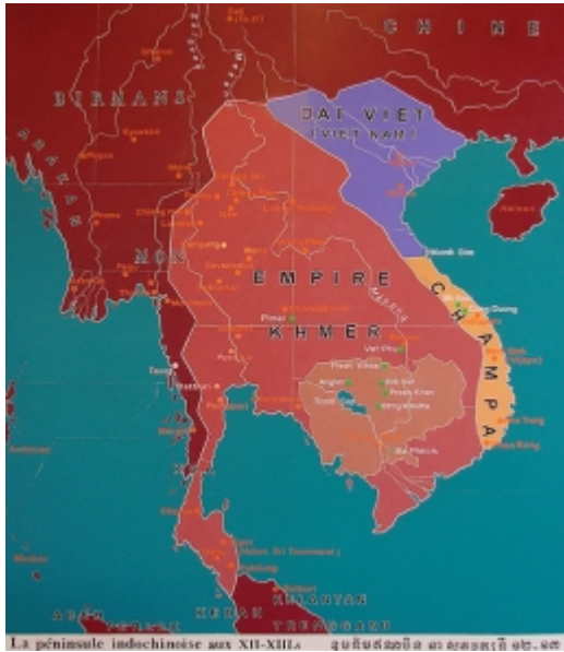
ទឹកដីខ្មែរ កាលពីខ្មែរជា ចក្រភពអង្គរ