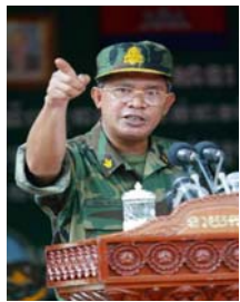
ប្រធានបក្ស ប្រជាជនកម្ពុជា