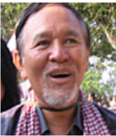
ប្រធានបក្ស សិទ្ធិចនុស្ស