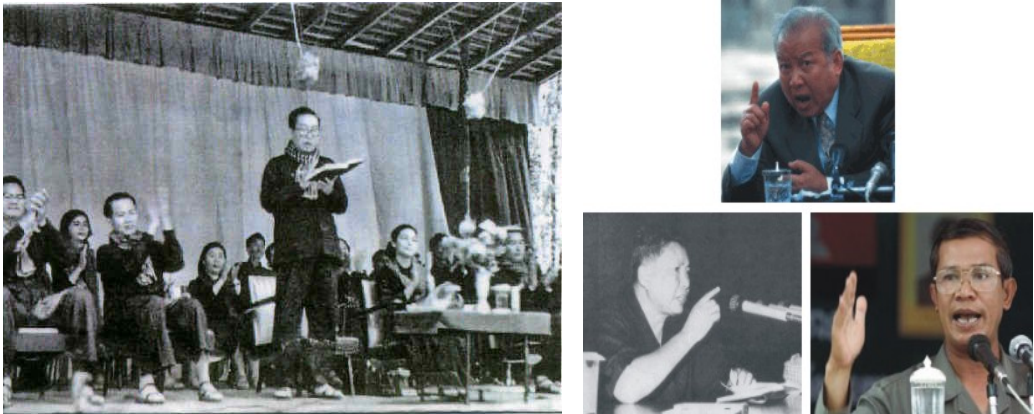
បើចង់រកយុត្តិធម៌អោយខ្មែរ ត្រូវកាត់ទោស ប៉ុល ពត សីហនុ ហ៊ុន សែន និងយួន ដែរ

អង្គការសហប្រជាជាតិដែលចង់រកយុត្តិធម៌អោយប្រជាពលរដ្ឋខ្មែរ និងចង់បំបាត់និទន្តភាពបានចំណាយ លុយជាច្រើនមកអោយពួកជនពុករលួយ។ ដើម្បីយុត្តិធម៌សំរាប់ជនរងគ្រោះខ្មែរ សូមអោយអង្គការសហប្រជា ជាតិ បញ្ចេញអោយអស់សមត្ថភាព ដើម្បីសំរេចនូវកិច្ចការជាប្រវត្តិសាស្ត្រនេះ។