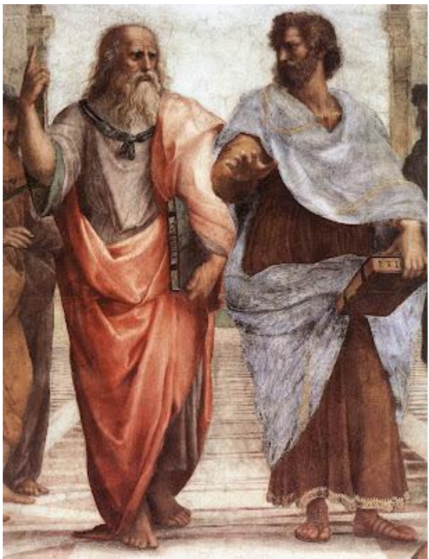
ផ្លាតូ(ខាងឆ្វេង) និងអារីស្តូត(ខាងស្តាំ)

ទ្រង់ទ្រាយរចនាសម្ព័ន្ធដឹកនាំ ៤ ទៀត គឺសក្តិភូមិ (Timocracy) គណាធិបតេយ្យ (Oligarchy) ប្រជាធិបតេយ្យ ( Democracy) និងទុជនាធិបតេយ្យ (Tyranny) បានឃ្លាតចាកពីរដ្ឋគំរូ ។ និយាយឲ្យខ្លីទៅ ទ្រង់ទ្រាយដឹកនាំរដ្ឋទាំង ៤ ខាងលើ គឺជាការដឹកនាំមួយដែលមេដឹកនាំមានការស្រលាញ់អំណាចហួស ។ របបអភិជនាធិបតេយ្យ(Aristocracy) គឺជាការដឹកនាំមួយដ៏ល្អប្រសើរ មានទំនុកទុកចិត្តពីប្រជាជន ។ អំណាចរបស់រដ្ឋនៅក្នុងដៃអ្នកដែលប្រសើរជាង ដែលបានផ្តល់ឲ្យដោយសុទ្ធចិត្តពីប្រជាជន ។ អំណាចរបស់រដ្ឋ ដឹកនាំប្រកបទៅដោយគុណធម៌ និងវ័យឆ្លាត ។ នៅលើគោលការណ៍ និងទ្រង់ទ្រាយនៃរចនាសម្ព័ន្ធដឹកនាំបែបនេះ គឺមានសមភាពតាំងពីកំនើតម្ល៉េះ ។ផ្លាតូបានអះអាងថា «សមភាពពីកំនើតបង្ខំឲ្យមានច្បាប់សមភាពសម្រាប់ទាំងអស់គ្នា ដែលបានសរសេរទុកនៅក្នុងច្បាប់និងជាកាតព្វកិច្ចសម្រាប់ទាំងអស់គ្នា ធ្វើសកម្មភាពចំពោះគ្នាទៅវិញទៅមក ក្នុងលក្ខណ៍ដ៏ប្រកបមួយ គឺពោរពេញទៅដោយកម្លាំងកិត្យានុភាព វិភាព និងវិចរណញ្ញាណ» ។