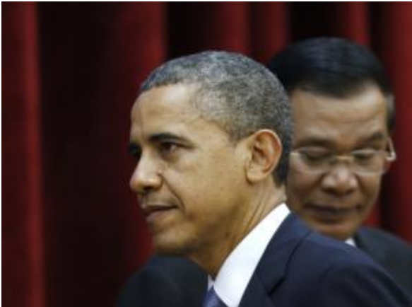
Barack Obama and Hun Sen

ដោយសារតែប្រទេសកម្ពុជា ល្បីល្បាញថាមេដឹកនាំផ្តាច់ការអ្នក លេងភ្នែកទោលជើងខ្លាំង ហ៊ិន-សែន ពូកែខាងសំលាប់រង្គាលប្រជាជនខ្មែរ និងប្រសប់ខាងបង្កើតឧក្រិដ្ឋកម្ម ប្រឆាំងនឹងមនុស្សជាតិខ្មែររាប់មិនអស់ មិនហើយ ទើបញ្ចាំងអោយ លោក