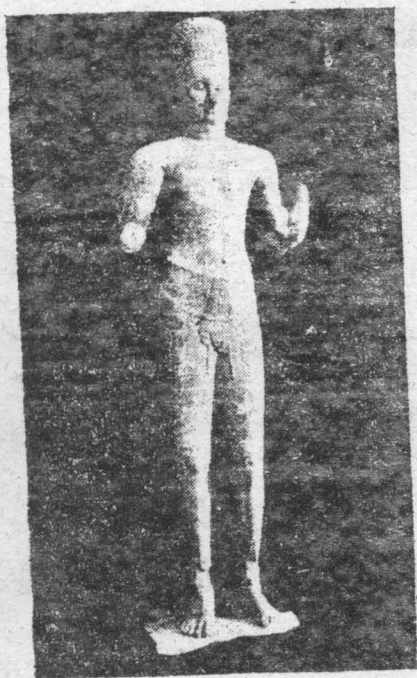
ព្រះហរិហរៈ