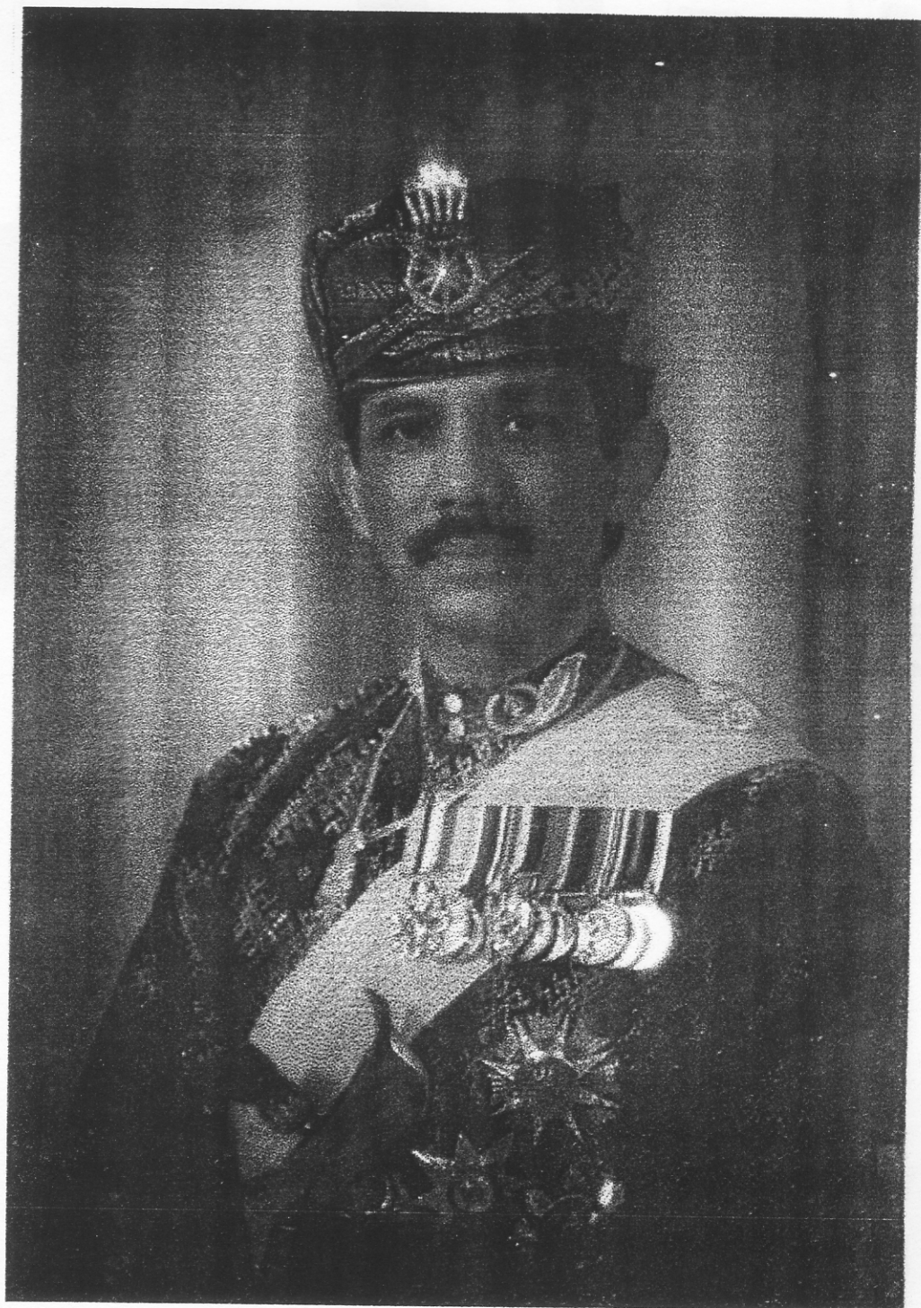
Kebawah Duli Yang Maha Mulia Paduka Seri Baginda Sultan Haji Hassanal Bolkiah Mu'izzaddin Waddaulah ibnu Al-Marhum Sultan Haji Omar Ali Saifuddien Sa'adul Khairi Waddien.

สุลต่านฮัจญี ฮัสซานัล โบลเกียห์ สุลต่านแห่งบรูไน