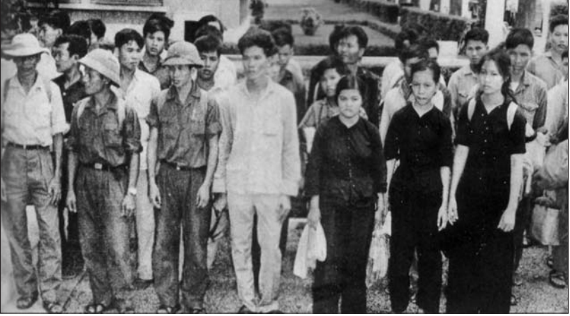
ពួកយៀកកុង-យៀកណាមខាងជើងទាំងអស់នេះ បានត្រូវស្តេចសីហនុបញ្ជា ប្រគល់ទៅឲ្យស្ថានទូតយួនយៀកកុងវិញ (ថ្ងៃទី២៧ កក្កដា ១៩៦៧)