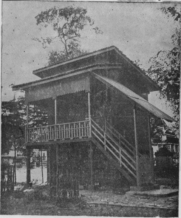
កូដិសមាធិ